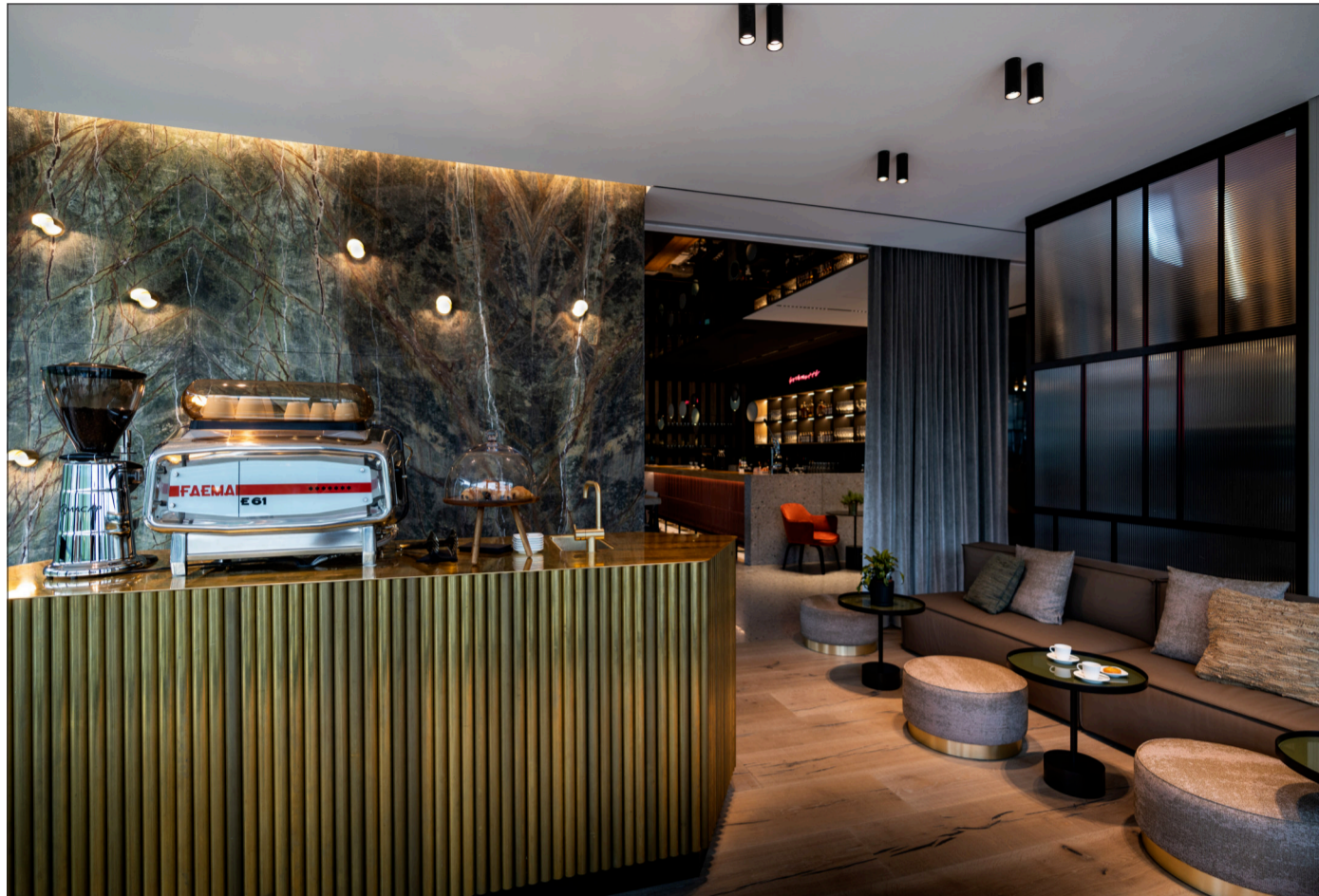
Wertige Materialien schaffen durch ihre klare Formgebung eine moderne und offene Atmosphäre.

Wenn in der Küche Heimatliebe und traditionell erlerntes Hand-