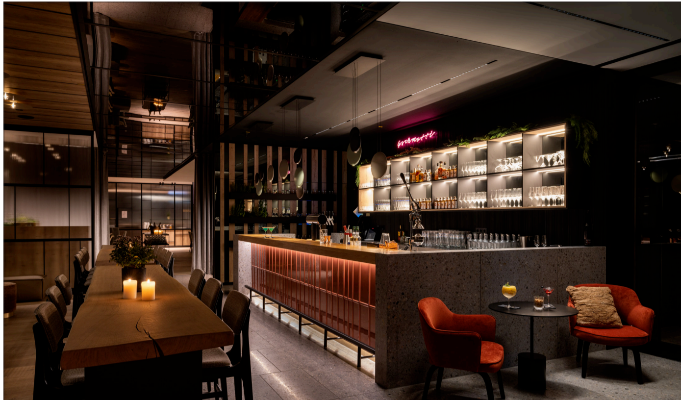
Das gastronomische Angebot des Hotels umfasst neben einem Restaurant auch eine Bar mit Bistro.

Ausgesprochener Wunsch der Bauherren war es, in die Umsetzung des Gesamtprojektes lokale und regionale Planer, Handwerker und Partner einzubeziehen. Neben der Bau- und Projektleitung wurden sowohl die Erdarbeiten als auch die Baumeisterarbeiten durch die eigenen Facharbeiter der Firmengruppe Meier ausgeführt. Die Baustoffe kamen soweit als möglich aus der Region, der Transportbeton aus dem eigenen Werk in Eichstätt. Dies sichert vor allem heimische Wertschöpfung und Arbeitsplätze