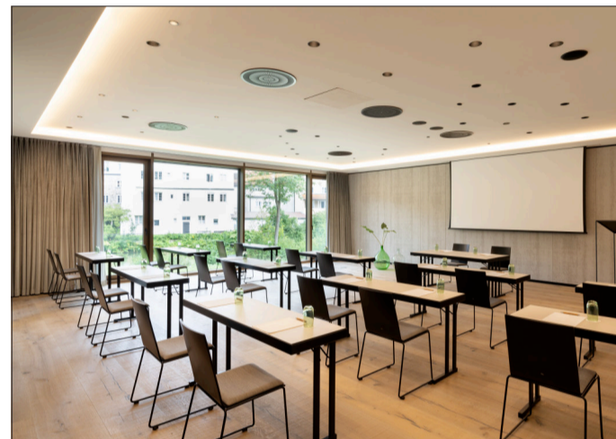
Das Hotel verfügt über mehrere multifunktionale Tagungsräume.

und schont gleichzeitig die Umwelt durch kurze Lieferwege.