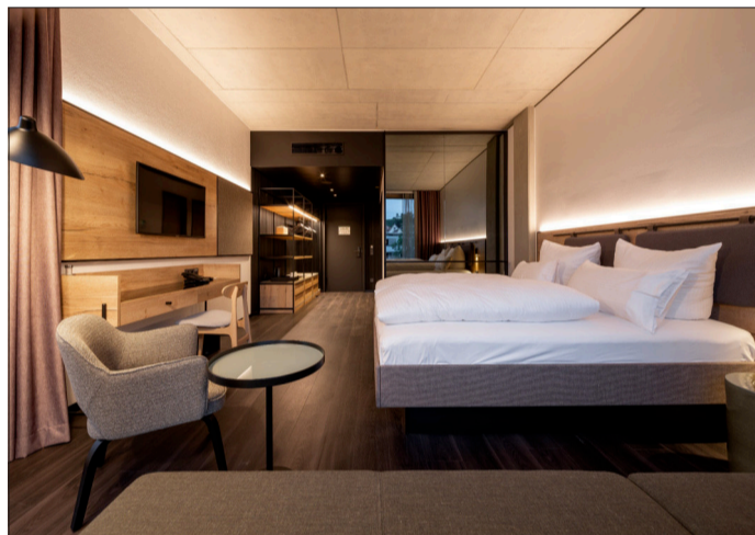
Die Zimmer sind zeitlos elegant und stilvoll eingerichtet.